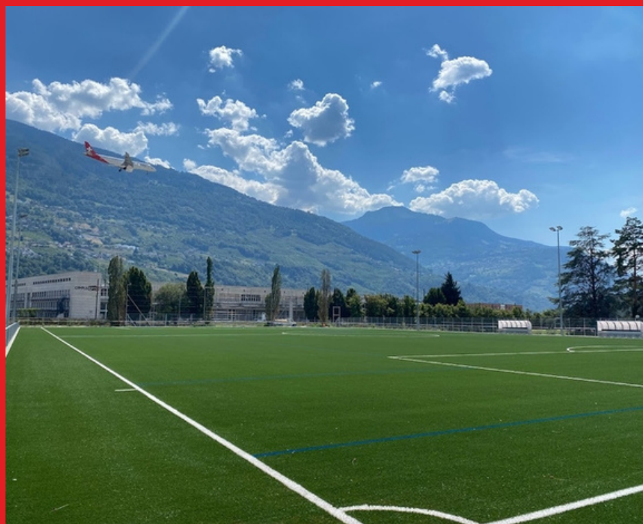
Ancien Stand, FC Sion