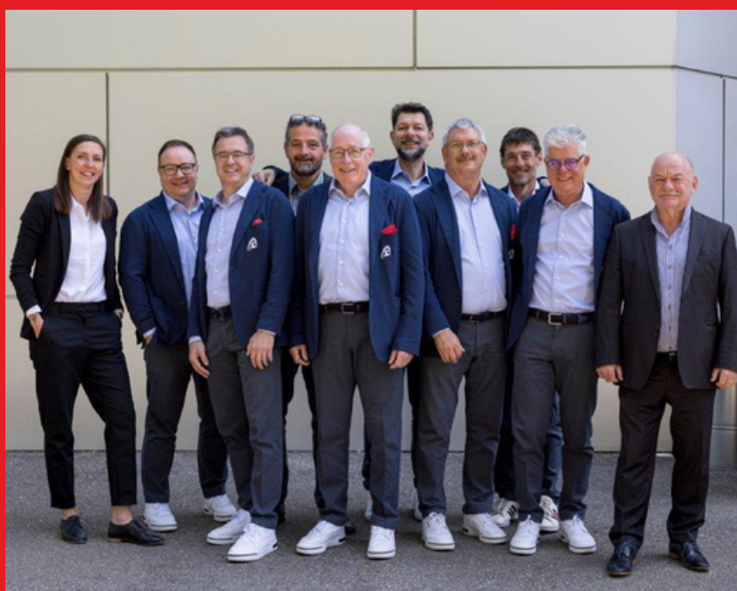
Vorstand der Amateurliga, Juni 2023