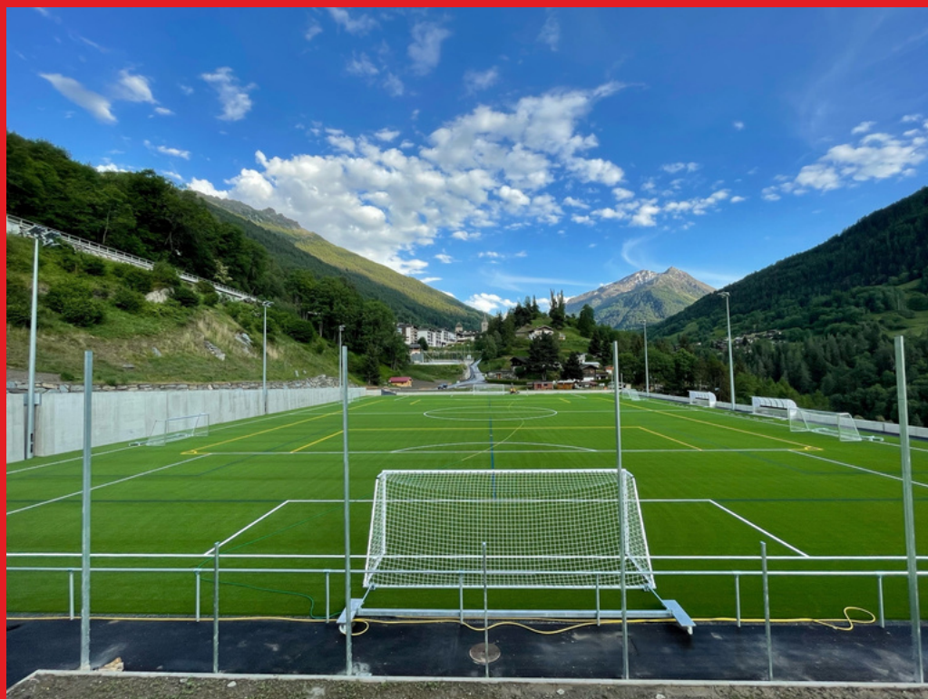
Terrain des Landoux, FC Anniviers

Unter folgendem Link finden Sie zudem interessante Unterlagen des Bundesamtes für Sport bezüglich Sportanlagen.